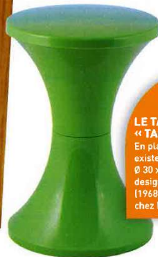
LE TABOURET « TAM TAM » En plastique, existe en 18 coloris, Ø 30 x H 45 cm, 22 €, design Henry Massonnet (1968), Stamp Edition chez Made in Design.