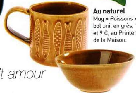
Au naturel Mug « Poissons » et bol uni, en grès, 10 € et 9 €, au Printemps de la Maison.