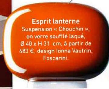
Esprit lanterne Suspension « Chouchin », en verre soufflé laqué, Ø 40 x H 31 cm, à partir de 483 €, design Ionna Vautrin, Foscarini.