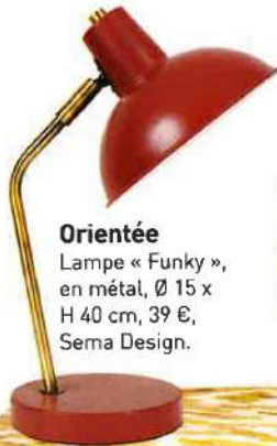
Orientée Lampe « Funky », en métal, Ø 15 x H 40 cm, 39 €, Sema Design.

est pomme et file le parfait amour avec la palette des ocres et marron.