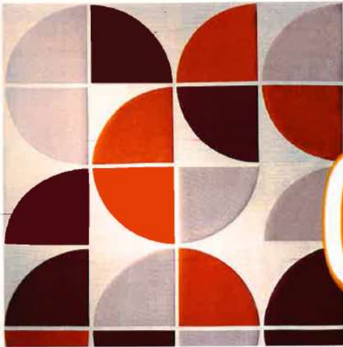
Jeu de cercles Tissu « Ocean Drive », en soie, L. 139 cm, 150,80 € le mètre, Misia.