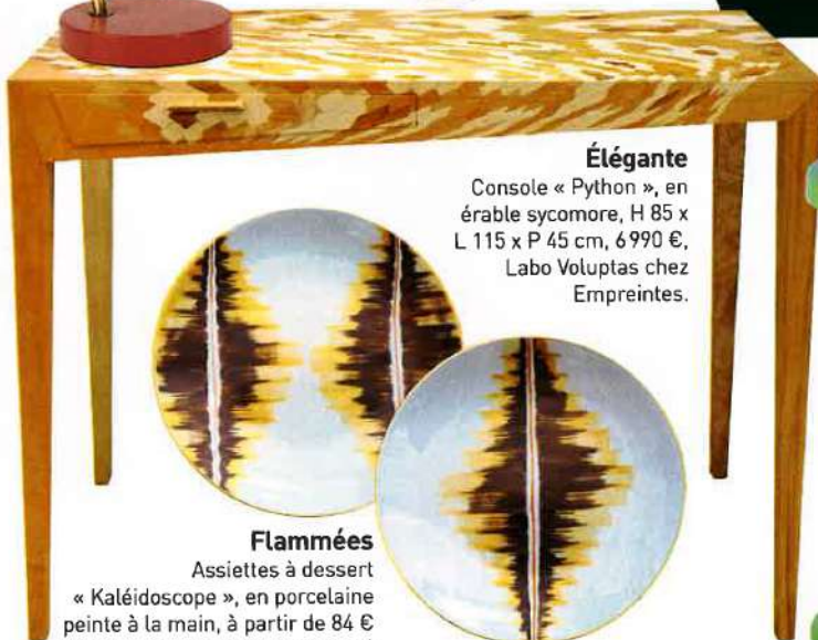
Flammées Assiettes à dessert « Kaléidoscope », en porcelaine peinte à la main, à partir de 84 € l'une, Marie Daâge en exclusivité au Printemps de la Maison.