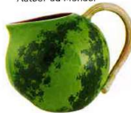
Rafraîchissant Pichet pastèque, en faïence, Ø 18,5 x H 20,5 cm, 75 €, Home Autour du Monde.