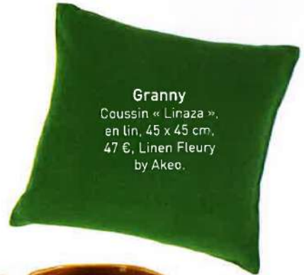
Granny Coussin « Linaza », en lin, 45 x 45 cm, 47 €, Linen Fleury by Akeo.