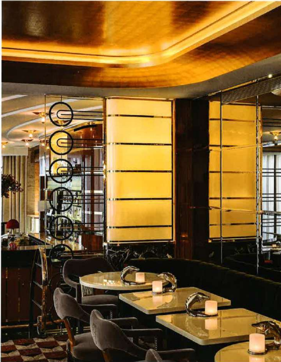
Ébénisterie, travail des métaux, du verre, du cuir... Bec allie tous les corps de métier à la Maison du Caviar, à Paris.